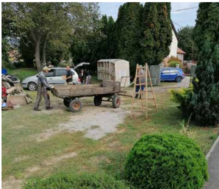
Zberné miesto na obecnom úrade