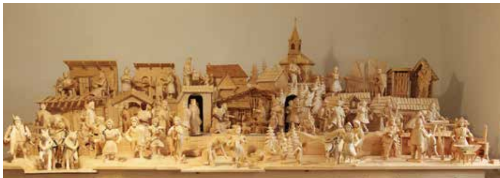
Pohyblivý betlehem- Život na dedine