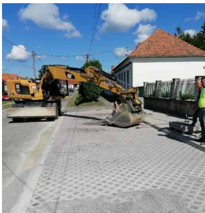
Úprava okolia kostola a vybudovanie parkovacích miest