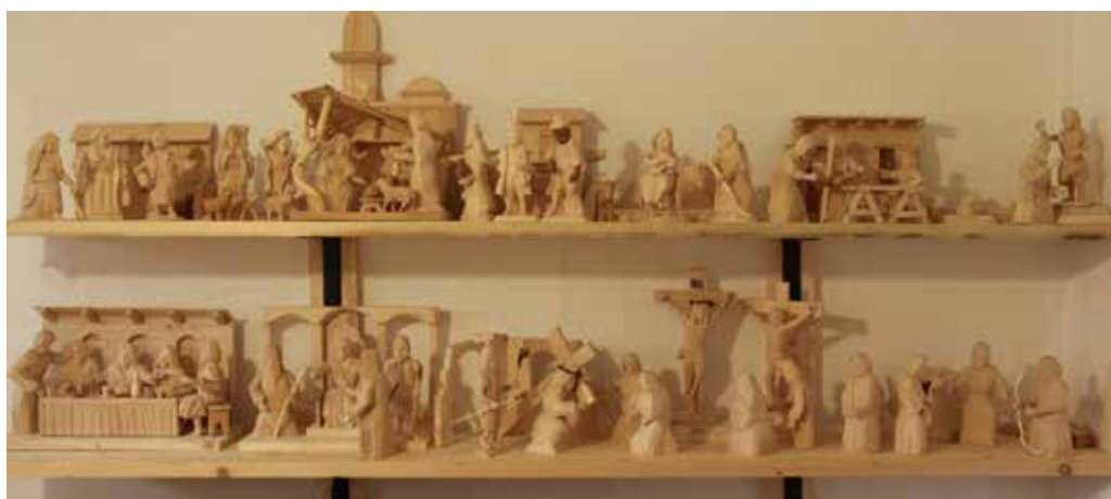
Život Ježiša Krista