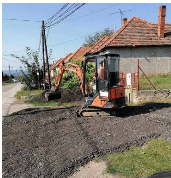
Úprava cestných komunikácií