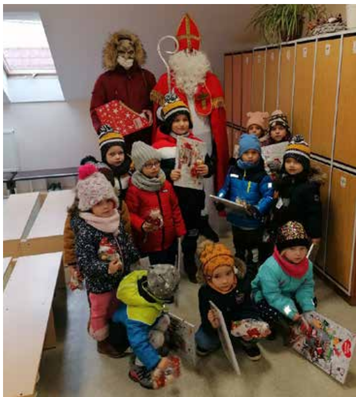
Zorganizovanie Mikuláša pre deti MŠ a ZŠ (obecný úrad a členovia združenia MLADÁ SILA)