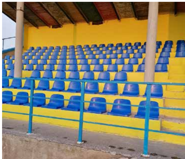
Rekonštrukcia futbalovej tribúny