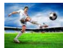
Predseda ŠK informuje