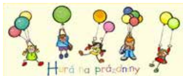
Prázdniny sú už tu!