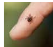
Nočná mora – kliešť