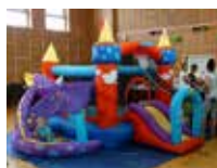
Oslavovali sme MDD