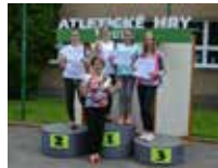
Aktivity našej základnej školy...