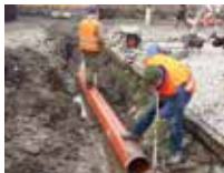
Budovanie kanalizácie 1