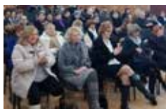
Medzinárodný deň žien 5