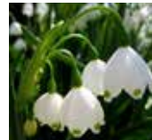
Jar v záhrade