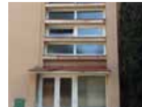
Výmena okien v ZŠ 3