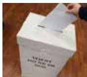
Ako sme volili v našej obci 2