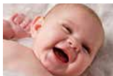
Uvítanie detí 3