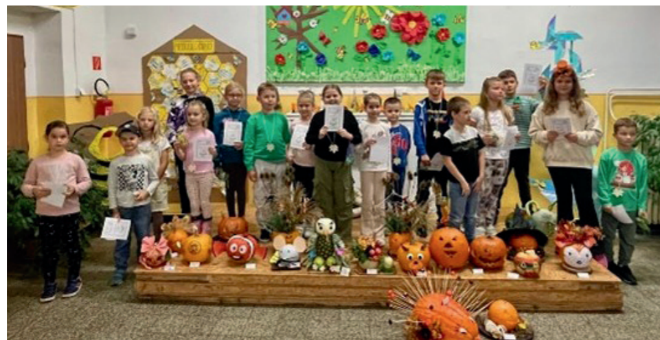
Jesenné šantenie s tekvičkami