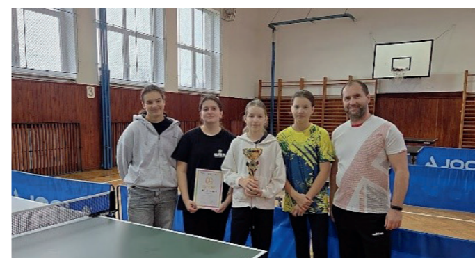
MO v stolnom tenise - dievčatá