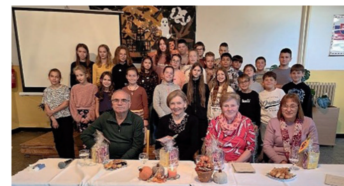
Beseda so starými rodičmi