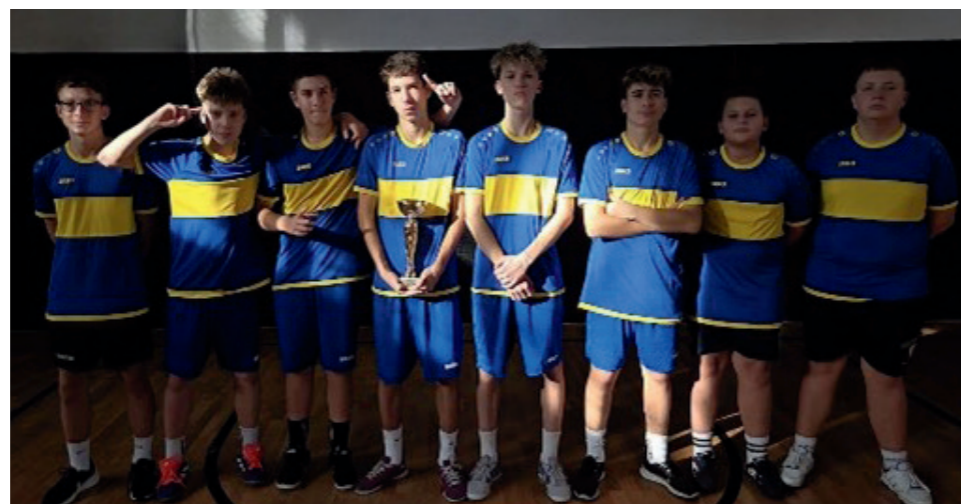
MO v basketbale