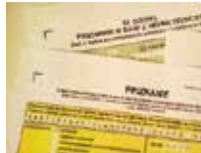
Kto musí podať daňové priznanie 2