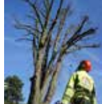
Orez a výrub stromov 3