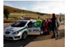
Polícia deťom 7