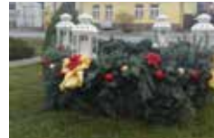
Adventný veniec v obci 6