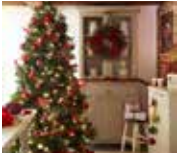
Koniec roka je tu 1